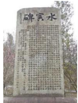
自然災害伝承碑 (広島県坂町小屋浦地区)