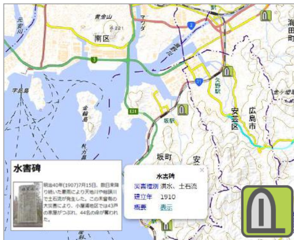
地理院地図における表示イメージ